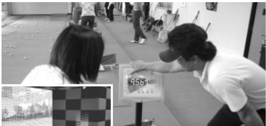
「インドア GOOD SHOT」を導入後の「VIVO ゴルフスタジオ」