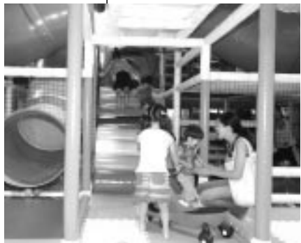
笑顔溢れる「Bb 築面船場店」のキッズコーナー

石川遼プロや宮里藍プロなど、若い選手の活躍によりますます賑わいを見せるゴルフ業界。プレーよりもおしゃべりなゴルフウェアから足を踏み入れる「ギャルファー」、ゴルフバーでわいわい楽しむ合