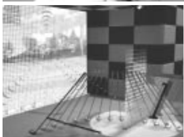
世界初、国際特許取得の音波センサーを搭載 正確さ99%以上の計測能力を誇る